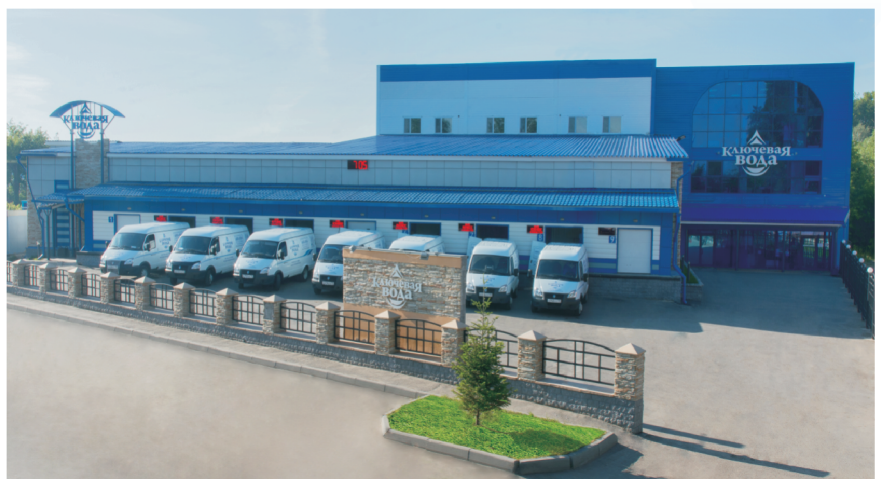
Административно-производственный комплекс компании «Ключевая вода»