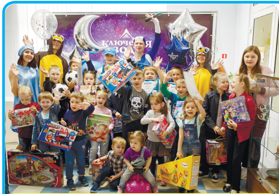
Работать в «Ключевой воде» — здорово, это даже дети знают